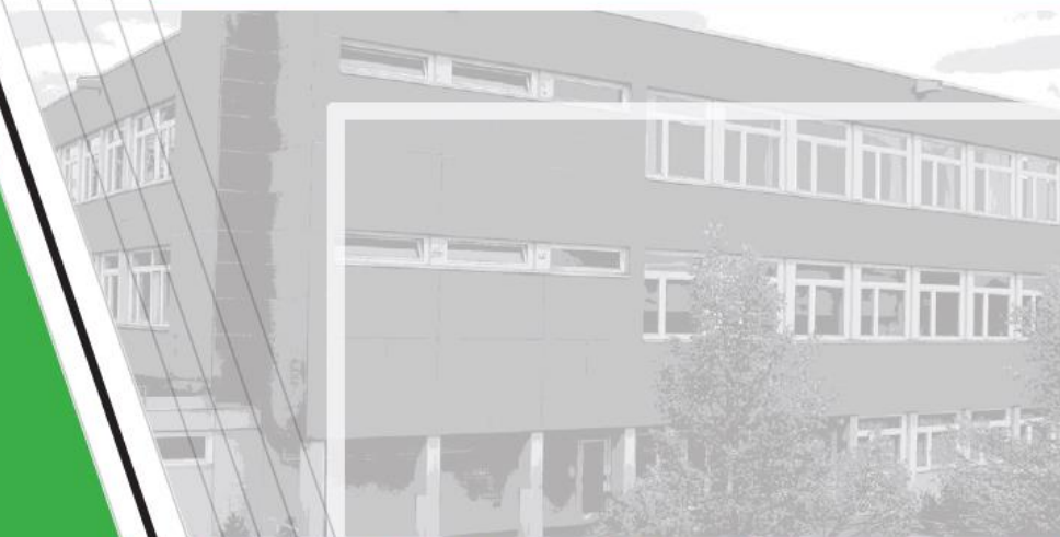
STAATLICHE REALSCHULE MARKTHEIDENFELD

Bestenförderung an der Realschule Marktheidenfeld