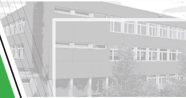
STAATLICHE REALSCHULE MARKTHEIDENFELD